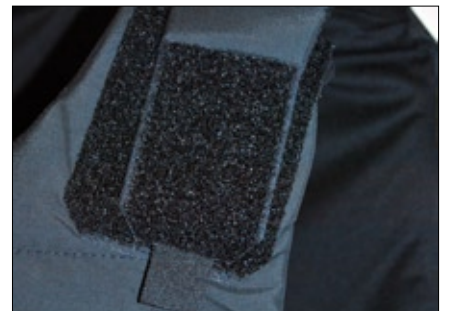
Cierre de velcro hombro.