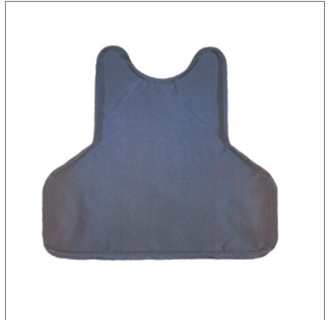
Funda paquete balístico.