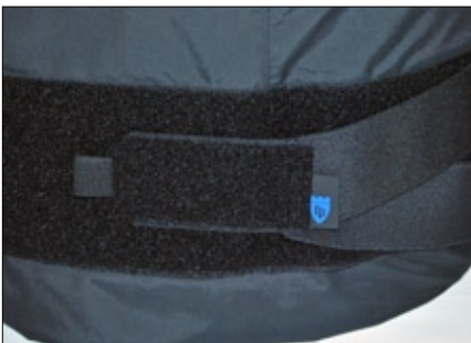
Cierre de velcro cintura.